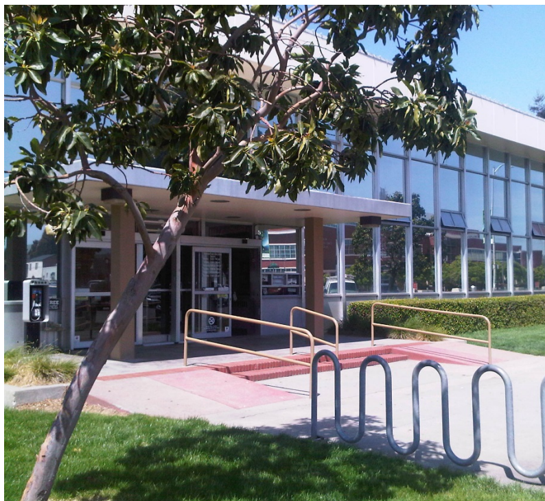
BIBLIOTECA CENTRAL EN CIVIC CENTER PLAZA Y MACDONALD